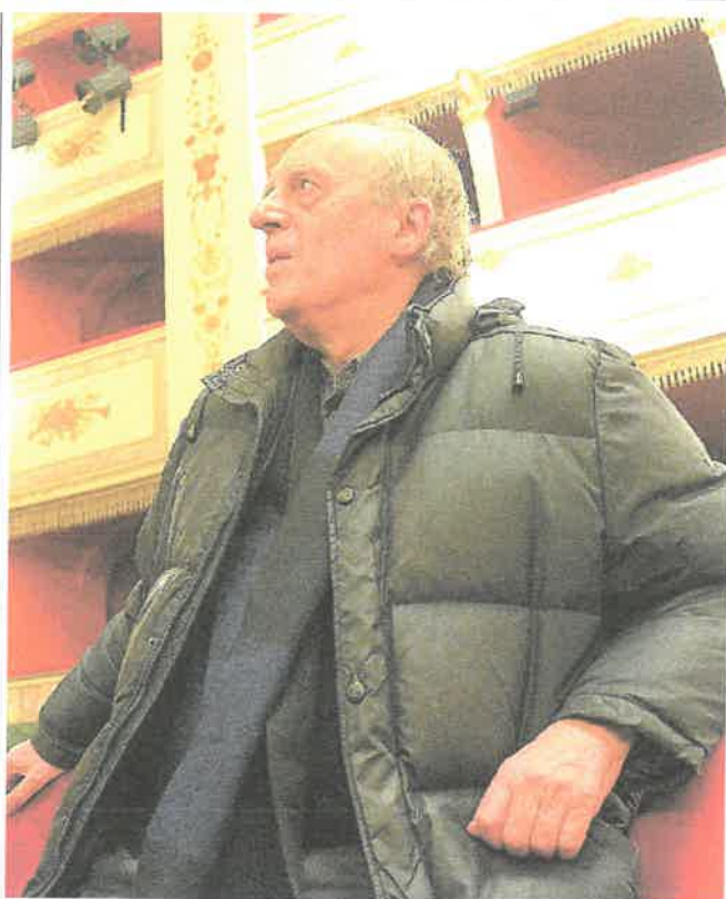
Dario Argento, romano, 78 anni

«Sta cercando una sua strada, una sua personalità con alcuni giovani talenti, ma ancora non c'è riuscito veramente. Che il cinema di genere oggi sia completamente dimenticato un po' mi rattrista, quando ci sono tanti ragazzi con la voglia di fare. Purtroppo i finan-