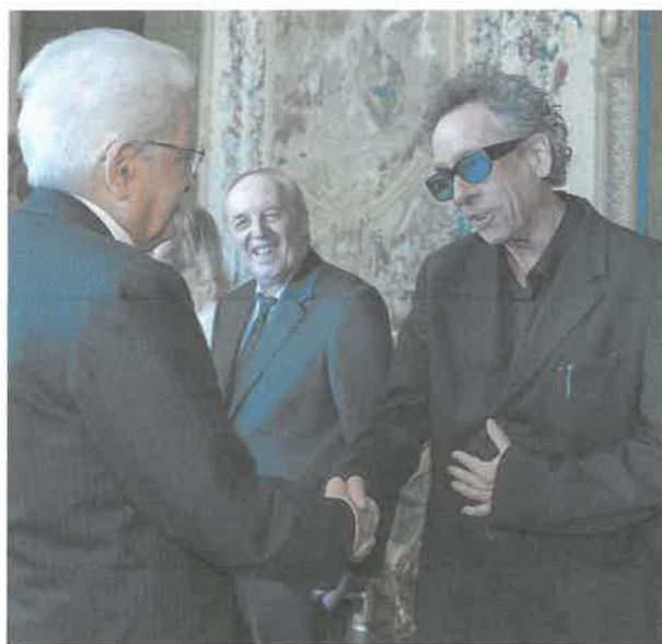
I registi Tim Burton e Dario Argento ieri al Quirinale da Mattarella

Al centro della storia c'è il maniero abbandonato della famiglia Wharton, in cui il protagonista si immerge in prima persona a caccia di oscuri segreti. Non mancherà una co-