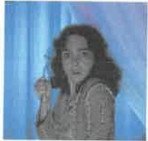
Suspiria Nel 1977 inaugura la "trilogia delle tre madri" con questo horror, di cui nel 2018 Guadagnino girerà un remake