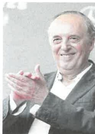
Dario Argento, 79 anni