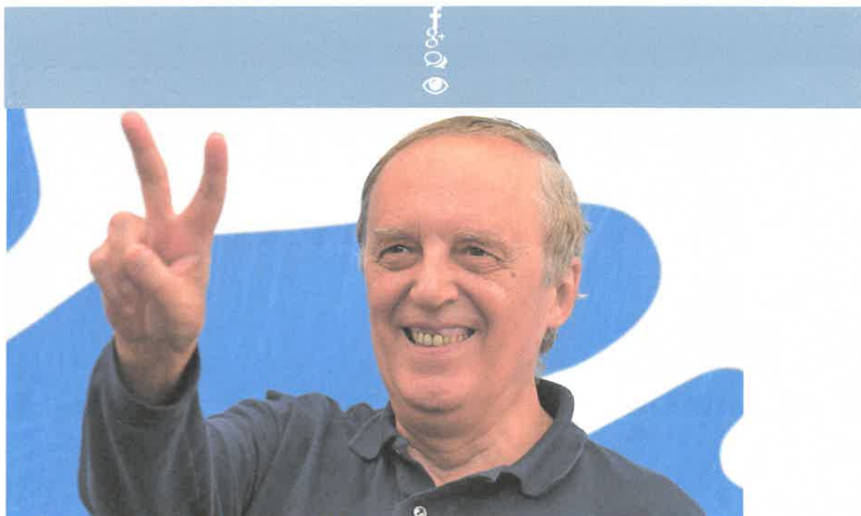
Dario Argento (78 anni) 7 settembre 1940, Roma (Italia) - Vergine.

L'iconico maestro dell'horror italiano riceverà uno speciale riconoscimento nella serata dei premi del prossimo 27 marzo.