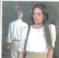
La sindrome di Stendhal Il film del 1996 segna la seconda collaborazione con la figlia Asia dopo Trauma . Insieme ancora nel 1998 per Il fantasma dell'opera

tanto nelle pause prendeva la chitarra e cantava, si riuniva una folla enorme».