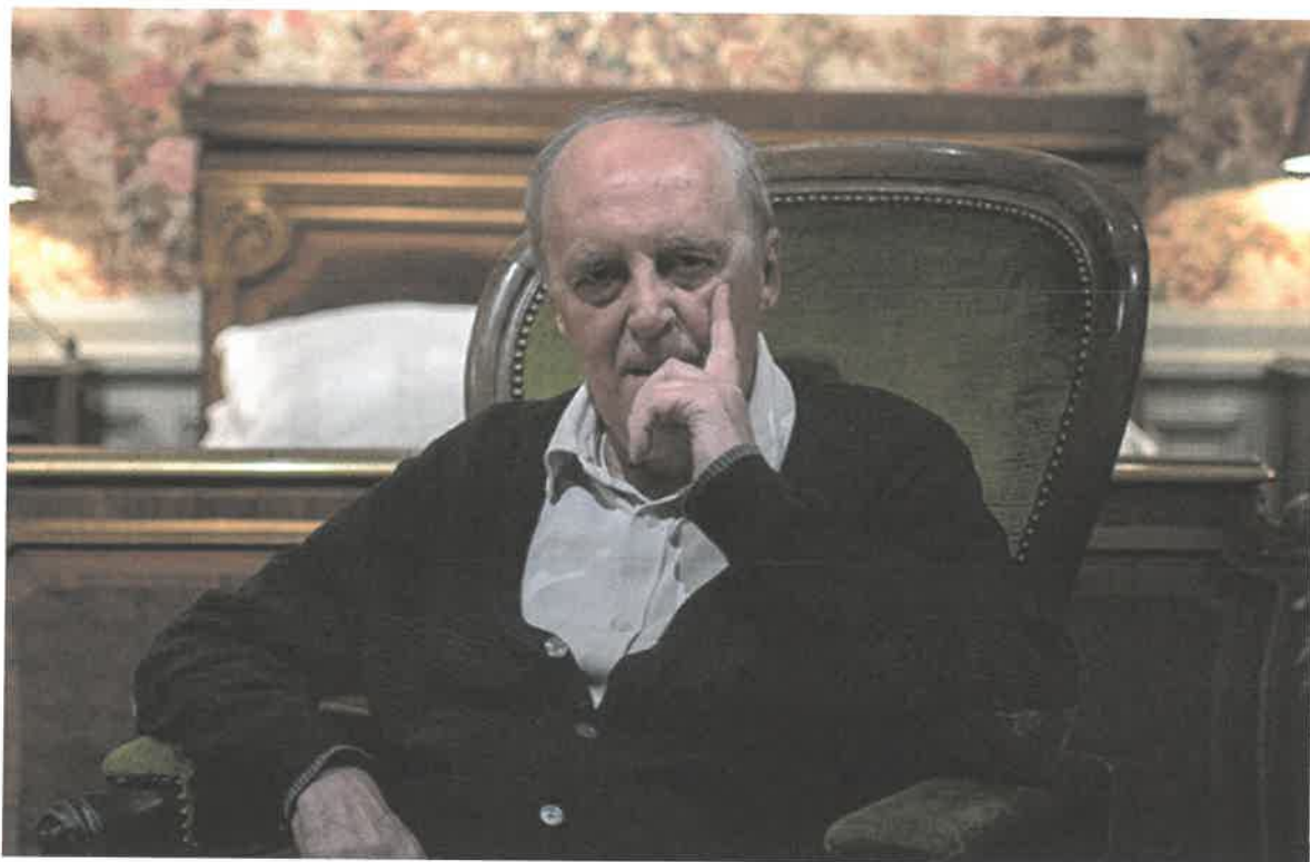
Dario Argento